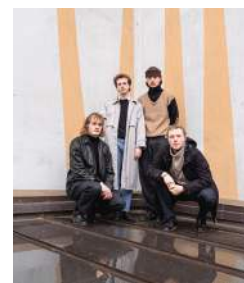
Raketenumschau, Foto: Ramon Brussog

Finde den THEATRON MUSIKSOMMER bei Facebook und Instagram