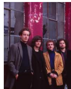
Prohibition Prohibition