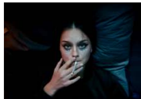
Ein Tag im Himmel