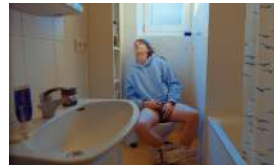
Die Mehrweg Affäre